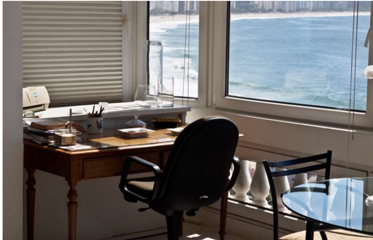
ARRIBA Desde la mesa de trabajo de Coelho se divisa la mejor panorámica de la playa de Copacabana. Le gusta escribir mirando al mar

“Yo nací en Río de Janeiro, en la Casa de Salud São José”, confiesa Paulo Coelho, el autor brasileño cuyos libros nos estimulan la capacidad de soñar y el deseo de buscar. Sus lectores se cuentan por millones desde que, en El alquimista , proclamó este credo: “Cuando quieres una cosa, todo el universo conspira para ayudarte a conseguirla”.