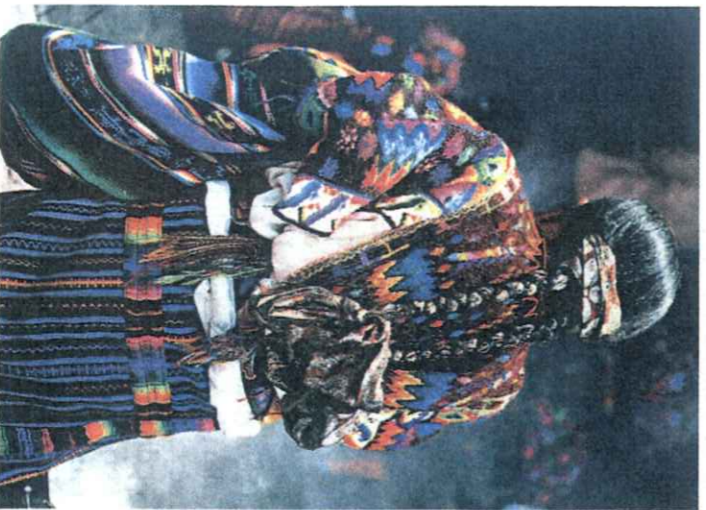
Arriba, miembros de la minoría garífuna en las Playas de Livingston. A la derecha, Guatemala City y sobre estas líneas, mujer con el atuendo tradicional.

Texto: M a Asunción Guardia.