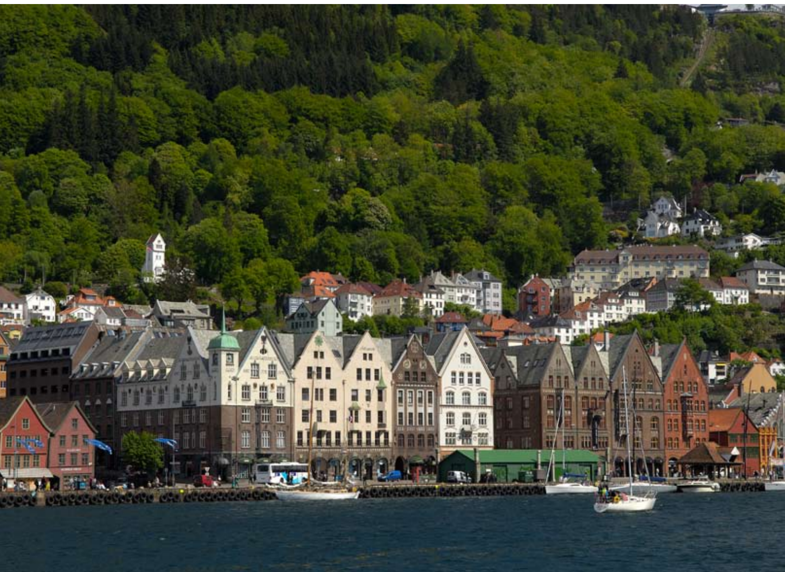
ARRIBA La ciudad de Bergen vista desde el mar DERECHA Las fachadas pintadas de vivos colores son toda una constante en la zona, como este 'atelier' de la localidad de Stavanger INFERIOR El tren de Flâm es una de las atracciones turísticas más populares de Noruega